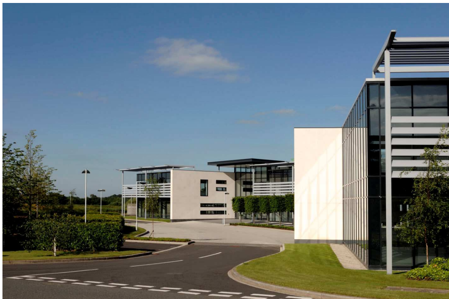
[Bild 2: Vector GB Ltd. in Solihull, Birmingham]