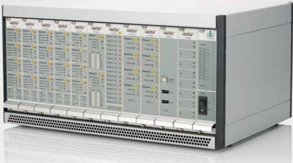
Herausforderung Steuergerätetest: Speziell auf die Bedürfnisse der Automobilindustrie zugeschnittene Testsysteme erlauben effiziente Funktionstests schon in frühen Entwicklungsphasen

Der Funktionstest von Steuergeräten im Automobil erfordert neben dem Prüfen der eigentlichen Funktionalität auch das Testen der wichtigsten Fehlerfälle. Die verwendeten Testsysteme müssen daher hohe Anforderungen erfüllen. Mit dem modularen und speziell auf die Bedürfnisse der Automobilindustrie zugeschnittenen Testsystem VT System des Unternehmens Vector