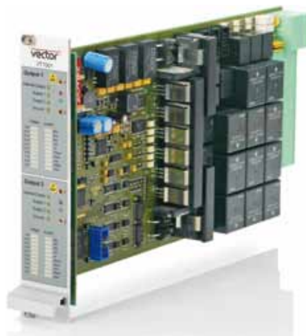
Bild 3: Das Modul VT7001 bedient die Stromversorgungseingänge eines Steuergeräts

Umgekehrt misst das Modul an jedem Kanal vom Steuergerät ausgegebene Digital- oder PWM-Signale und Spannungen. Über einen zuschaltbaren Widerstand werden Lasten simuliert oder Pull-up/down-Schaltungen realisiert.